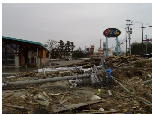
2011.3. 15 宮城県石巻市