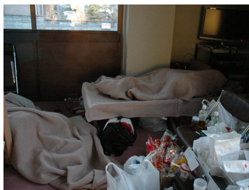
建物の中でも寒かった