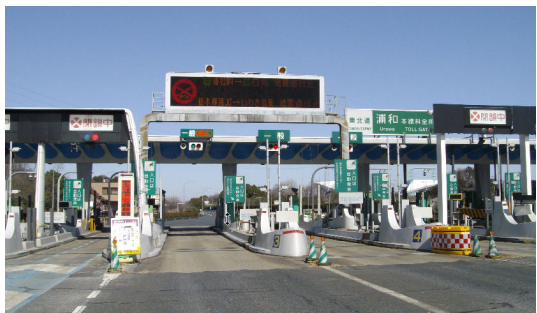
平成23年3月12日 午前9時浦和インター