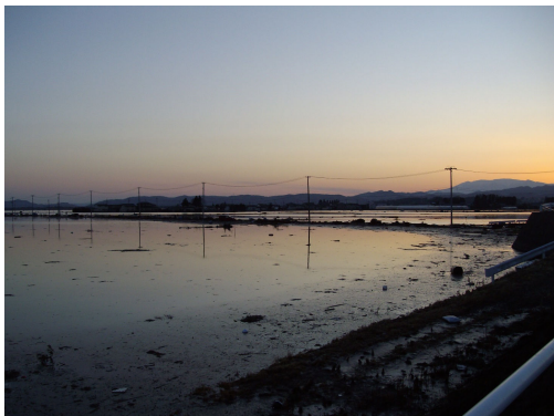
2011.3.12 18頃 宮城県名取市