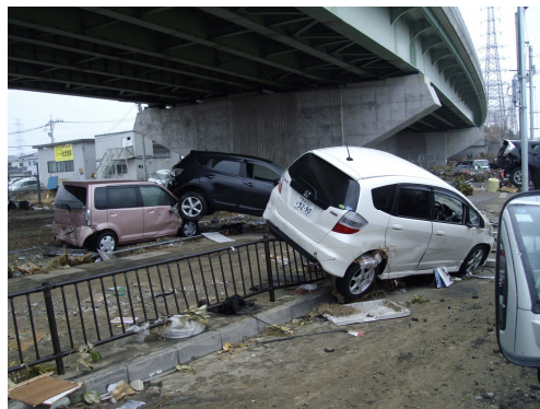
2011.3. 15 宮城県石巻市