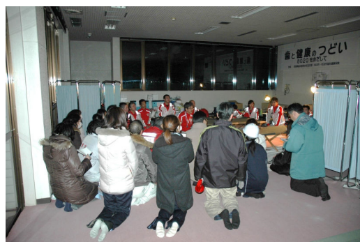
平成23年3月15日20時 宮城県岩沼市救護所 A. KATSUMI Japanese Red Cross Musashino Hospital