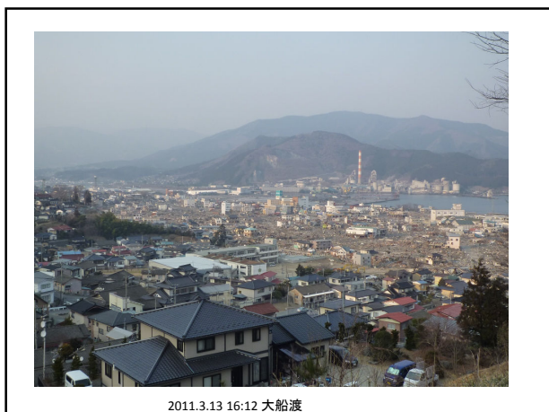
2011.3.13 16:12 大船渡