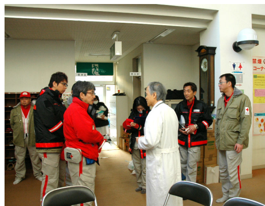
名取市保健センター A. 情報収集 Red Cross Hospital