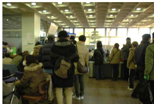
名取市役所 情報収集 12日 16:30