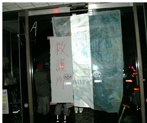
A. KATSUMI Japanese Red Cross Musashino Hospital

平成13年3月12日19時 日赤救護班到着 (発災から約26時間後) 医師会医師1名で実施