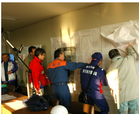
名取市役所 市災害対策本部にて情報収集 12日16:30